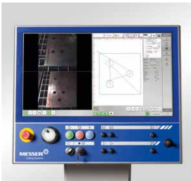
Die neue Steuerung Global Control mit 24"-Touchscreen Monitor bietet viel Platz, eine klare Bedienung und ist bei Bedarf flexibel konfigurierbar