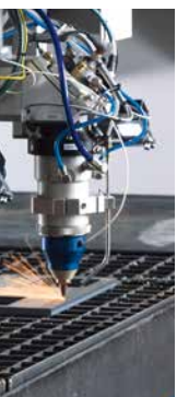
elbetrieb plung der