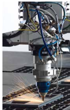
Zwei Laserköpfe im Parallel ermöglichen eine Verdopplung der Schneidleistung