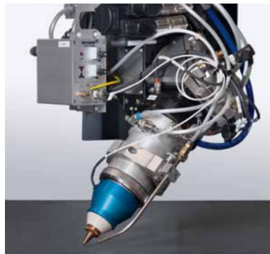
Der endlos drehbare Fasenkopf mit magnetischem Havarieschutz ermöglicht Fasenschnitte bis 50°