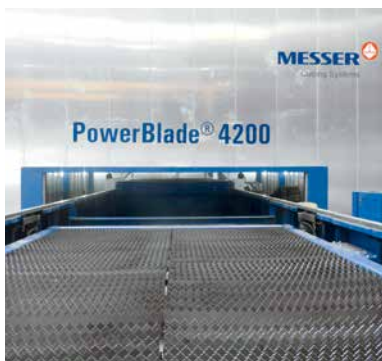
Die Volleinhausung und der Wechseltisch gewährleisten absolute Lasersicherheit beim Faserlaser